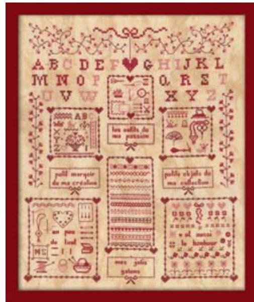
Affaires des brodeuses € 12,25