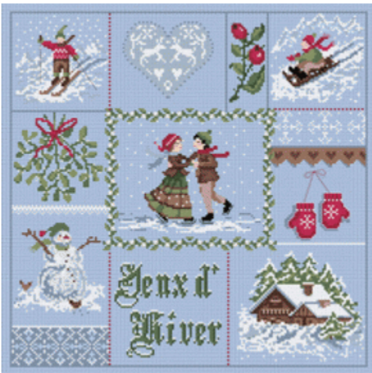
Jeux d'Hiver € 17,95