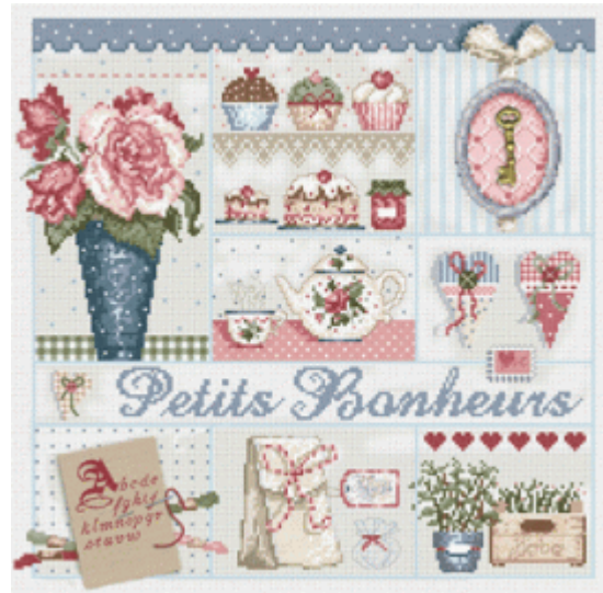
Petits Bonheurs € 17,95