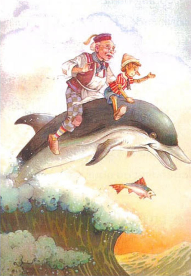
Pinocchio € 23,50