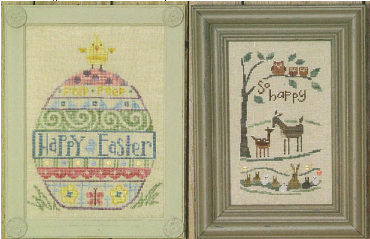
Uber Egg € 12,50 (incl. kleine knoopjes)

Dit redden we niet meer voor Pasen, maar er is altijd Pasen volgend jaar. Een geweldig leuk "EI" patroon van de dames van Bent Creek. Als je daar niet een voorjaarsgevoel van krijgt..... Daarnaast nog een heel lief buitentafereltje.