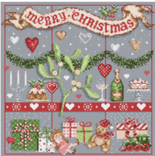
25 Decembre € 17,95