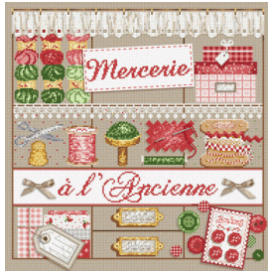
Mercerie a l'Ancienne € 17,95

En vergeet niet om een kijkje te nemen op de website van Madame la Fee, ze heeft een aantal bijzonder leuke gratis patroontjes erop staan: