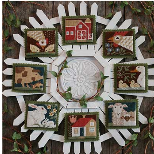
Welcome Spring € 9,25