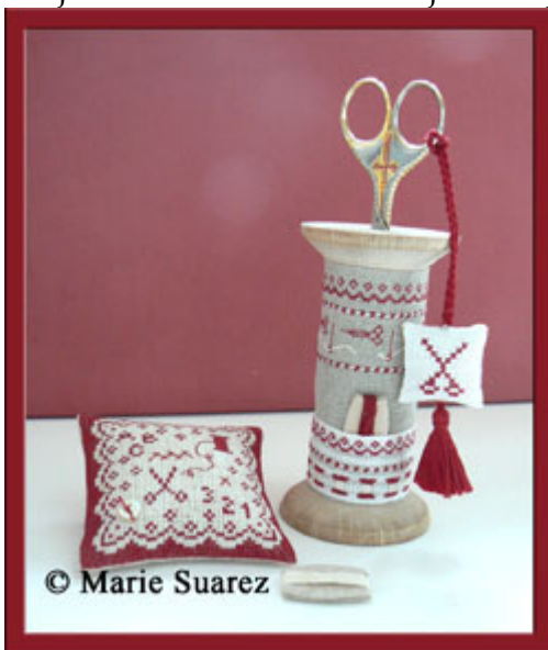
Bobines Cheries € 12,25

Op de beurs in Parijs zijn we deze ontwerpster tegengekomen en we zijn heel blij om te merken dat jullie net zo enthousiast zijn als wij. Hieronder zie je een aantal van haar ontwerpen.