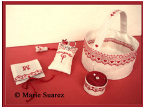
Ma Belle Paniere € 15,95