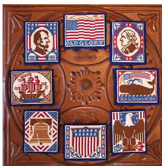
Stars and Stripes € 9,25

En vergeet niet dat als er nieuwe patronen uit, er ook een nieuwe freebie is op de website: