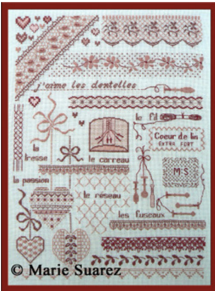
J'aime les dentelles € 13,50