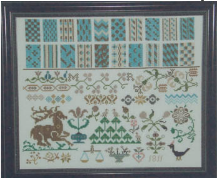
MR 1811 € 15,95

Deze nieuwe ontwerpen heeft vooral reproductiemerklappen in het assortiment. De onderstaande hebben we inmiddels in de winkel, ik vind de vulpatronen geweldig.