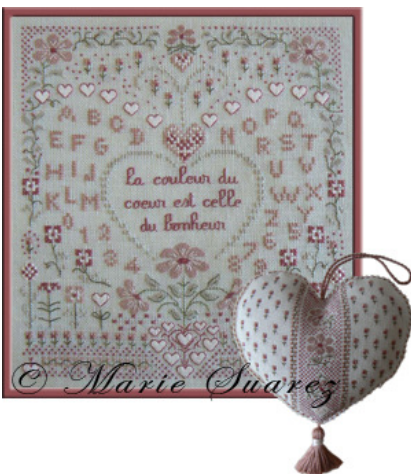
La Couleur de Coeur € 12,25