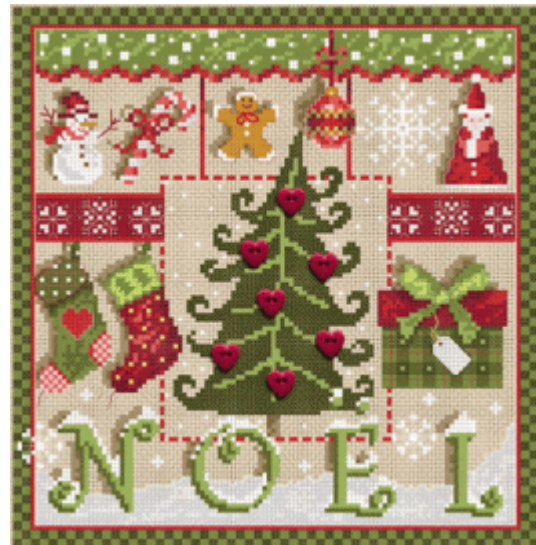
Petits Coeurs de Noel € 13,25