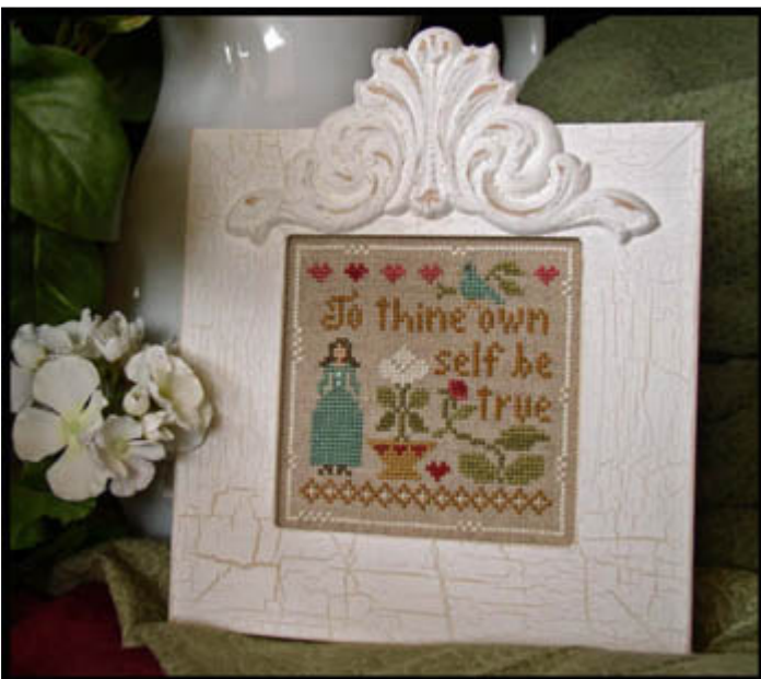
Be True € 6,95