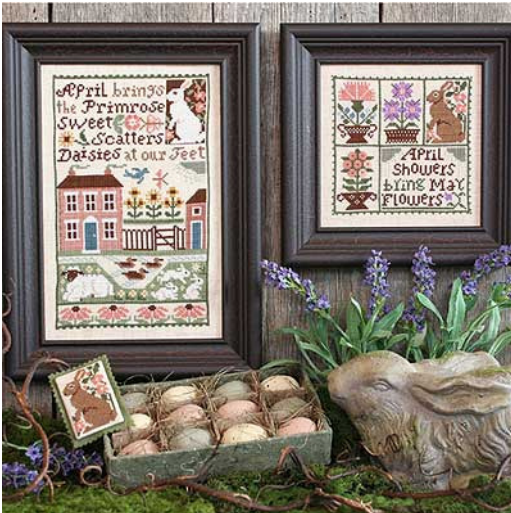
April € 9,25

Altijd een paar weken later dan Nashville, maar in maart kwamen dan toch de nieuwe ontwerpen van The Prairie Schooler binnen. En het is altijd de moeite van het wachten waard.