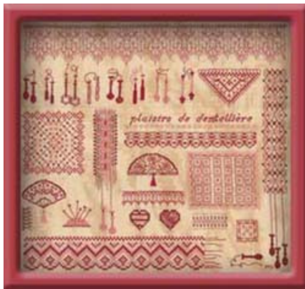
Plaisirs de dentellière € 12,25