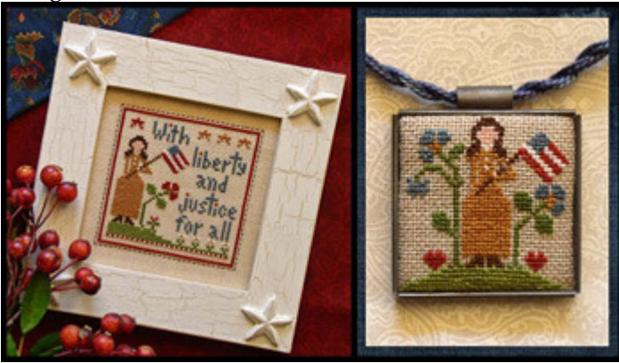
Liberty and Justice € 6,95