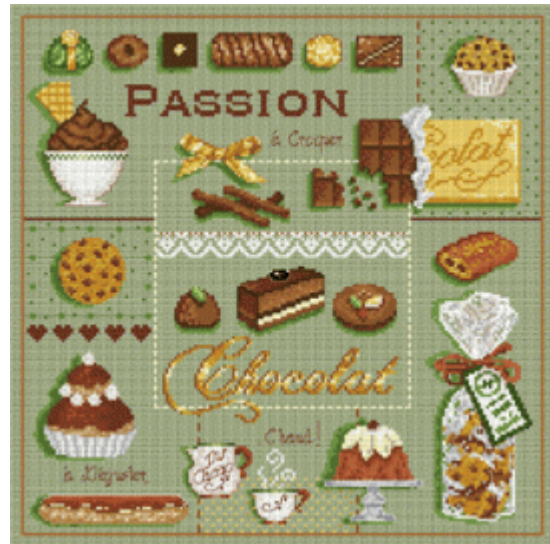
Passion Chocolate € 17,95