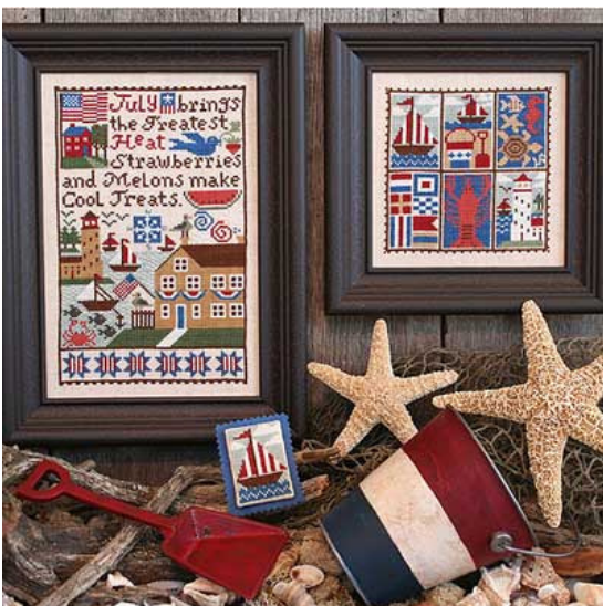
July € 9,25