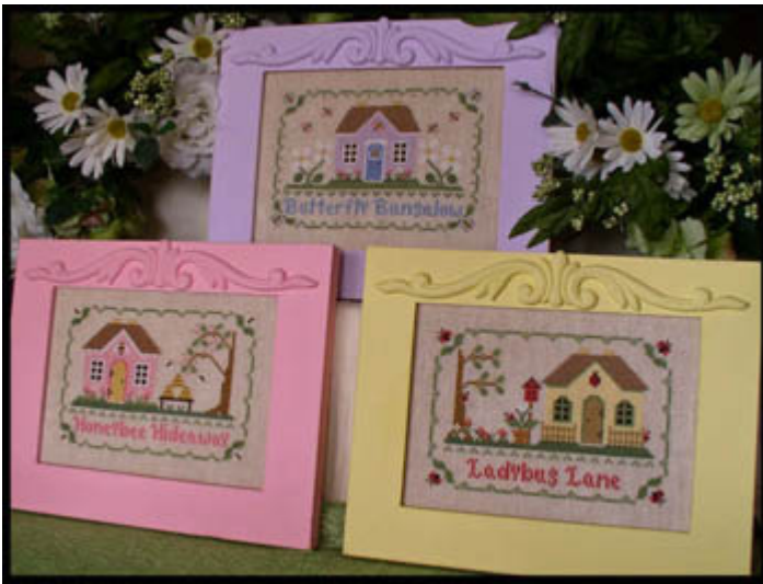
Summer Retreats € 11,50