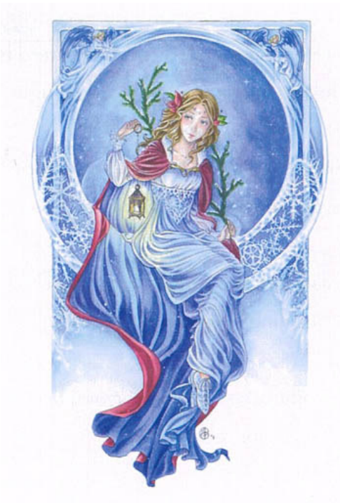
Christmas Lights € 16,95