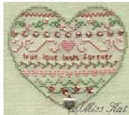
Coeur True Love € 12,25