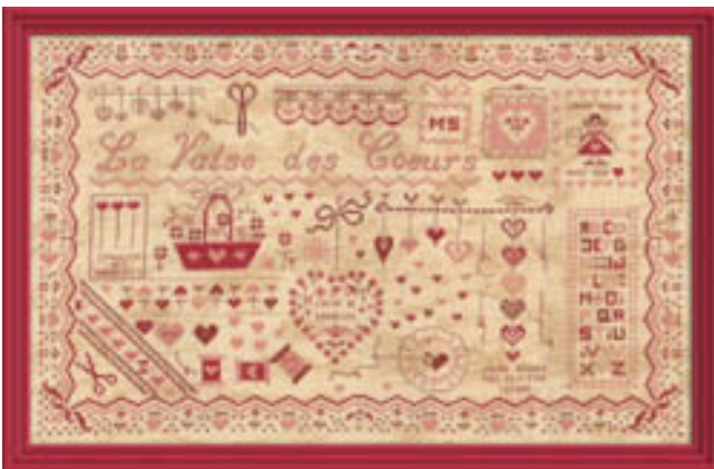
La Valse des Coeurs 12,25