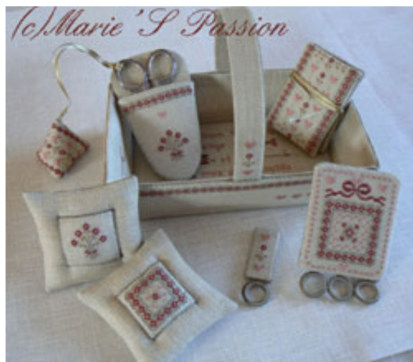
Dans mon panier joli € 16,50