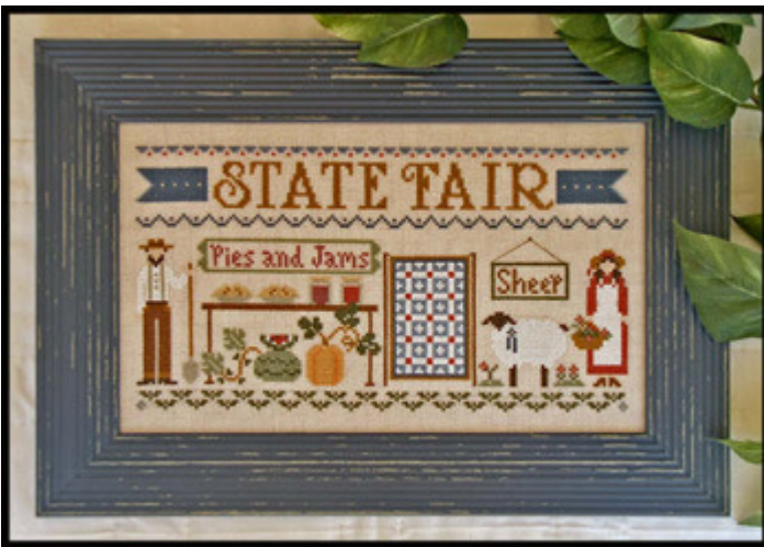
State Fair € 9,25