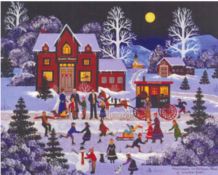
Moonbeams on Millborn Pound € 16,95

Deze ontwerpen hebben we niet standaard in de winkel, maar kunnen we zo voor je bestellen. Er zijn steeds meer borduursters die aan deze kunstwerken beginnen, sommigen borduren ze over 1 draadje op 10 draads linnen, anderen op aida stof van 8 bosjes/cm. Op de website van onze distributeur Hoffman ( www.hoffmandis.com ) kun je de patronen vinden onder de Online Reference Catalogue, Designer Search en dan onder de H van Heaven and Earth Designs). Hieronder alvast een paar ontwerpen om in de stemming te komen.