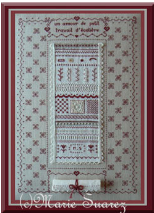
Un amour de petit travail d'ecoliere € 13,95