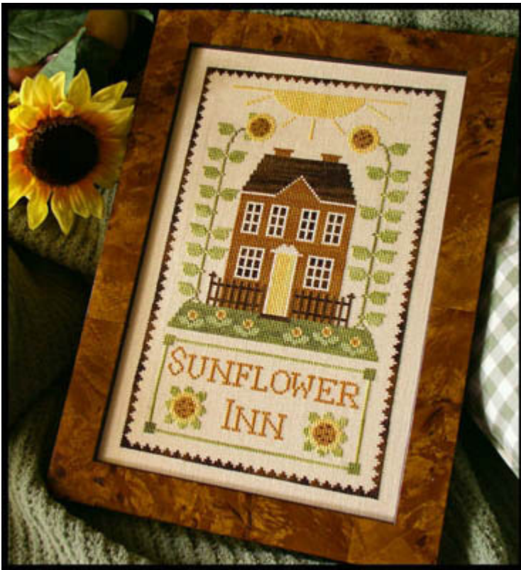
Sunflower Inn € 9,25