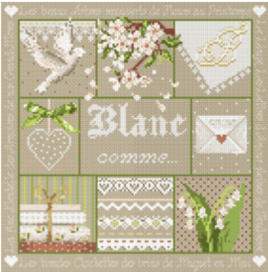
Blanc Comme.... € 13,25

Ook een ontdekking van de beurs in Parijs, Madame la Fee. Prachtige, vrolijke patronen die je in allerlei combinaties kunt borduren.