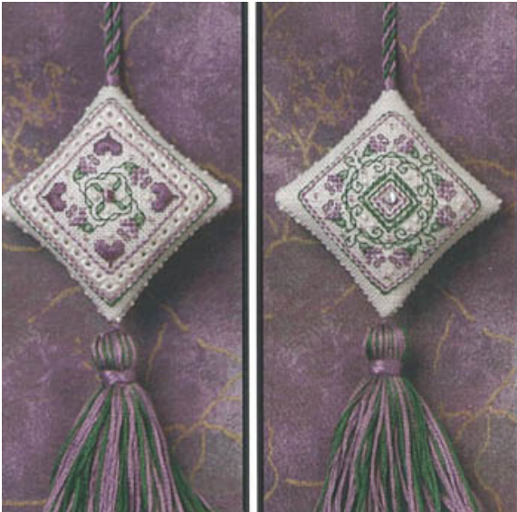
Lavender Blossom Fob € 11,50