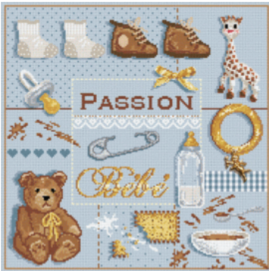
Passion Bebe – Bleu € 17,95