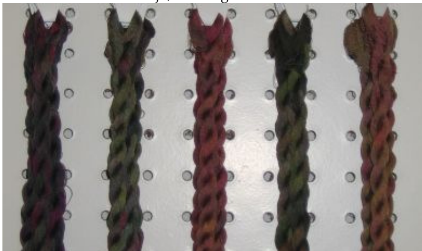
Van links naar rechts: 116 Renoir, 117 Niky, 118 Mary C, 119 Gabriele, 120 Boucher

Ze hangen al even in de winkel, maar ik had nog geen goede foto van de nieuwe kleuren van de Tentakulum zijde. De strengetjes zijn wat kleiner geworden, de 100/3 zijde heeft 50 meter net als de soie surfine. Dus kun je nu voor € 3,75 met deze heerlijke zijde borduren. Houd er rekening mee dat dit exclusieve kleuren zijn, een volgend verbad kan er anders uitzien.