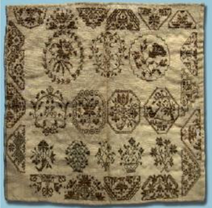
Companion to Beatrix Potter