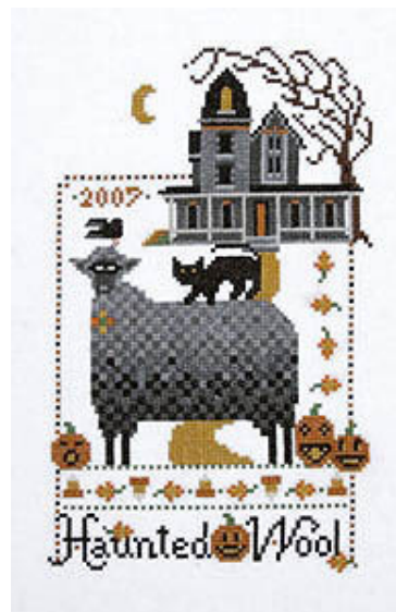
Kit & Bixby - Haunted House