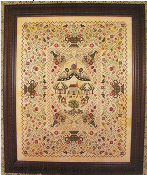
Rosewood Manor - Inspirations