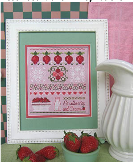
Casey Buonaugurio Designs - Strawberries and Cream