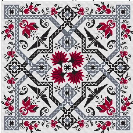
Jardin du Plaisir